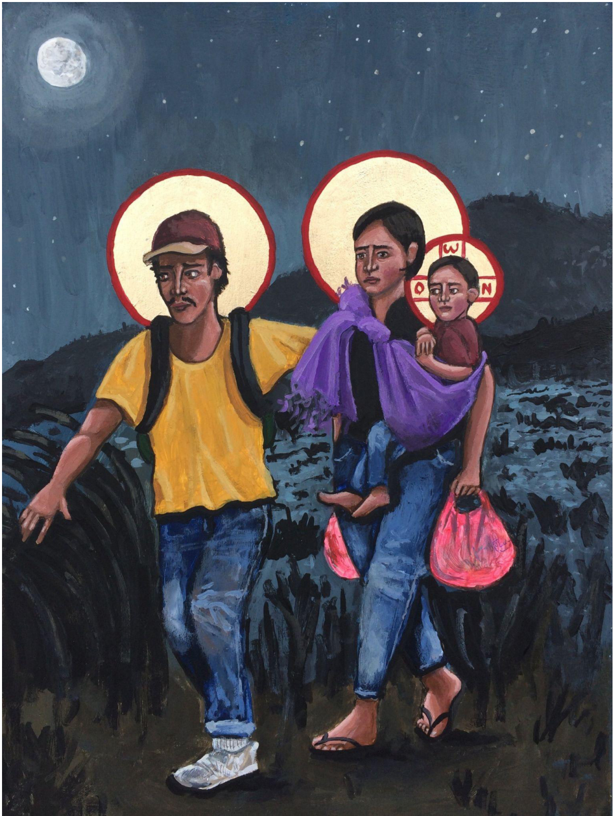
“La Sagrada Familia” de Kelly Latimore